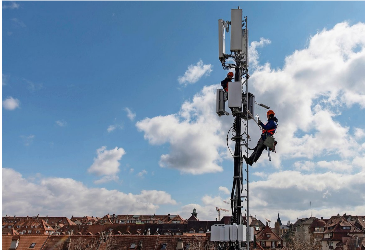
Marktführer Swisscom hat viele Mobilfunkantennen mit einem Software-Update auf den neuen Standard 5G aufdatiert.

Ein weiterer Grund für die Zunahme dürfte sein, dass die Betreiber von der Möglichkeit Gebrauch gemacht haben, auf ihren Sendeanlagen die bestehenden Module durch 5G-Module zu er-